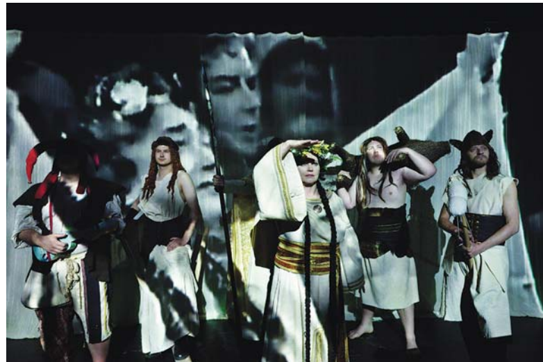
Oceněná hra Smíření měla premiéru na prknech Komorní scény Aréna loni v červnu.